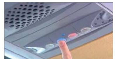
Service Sets mit Lautsprecher und LED Leuchte