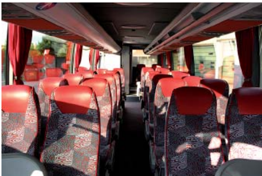
Geräumige Komfort-Innenausstattung mit Teillederbesatz

Omnibusse und Limousinen für höchste Ansprüche.