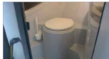
WC-Waschraum im Heck