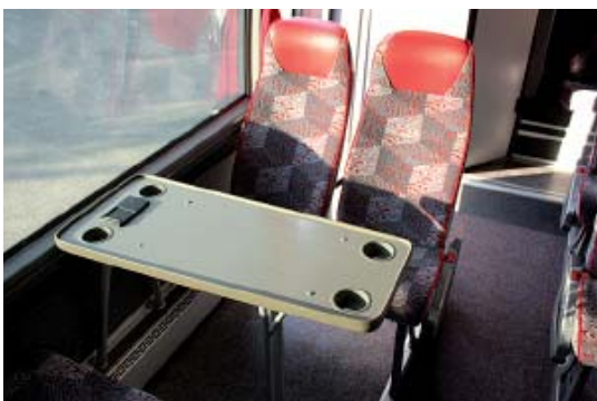
2 Skattische mit 8 sich gegenüberliegenden Sitzen „face to face“