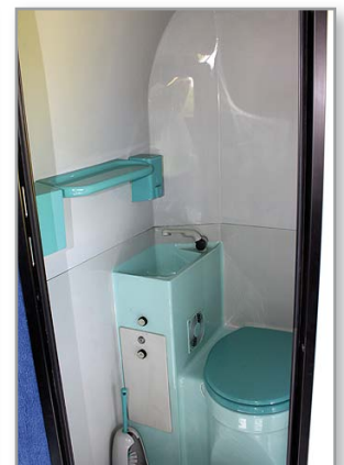
WC-Waschraum im Heck