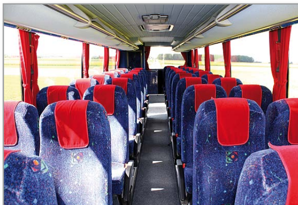
Geräumige Komfort-Innenausstattung mit 83 cm Sitzabstand