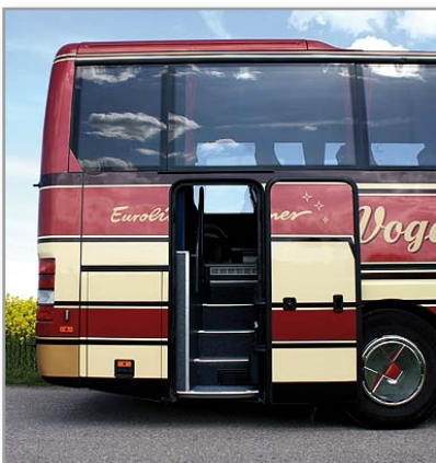
Bequeme besonders breite Einstiege